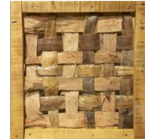
Gambar 10. Hasil pemotongan ujung kulit yang melebihi bingkai penjepit