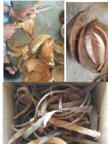
Gambar 6. Tahap 1 – pemisahan serabut dari kulit luar

serabut dalam ember atau tempat penyimpanan yang sesuai.