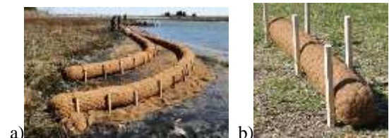
Gambar 3. Batang Sabut Kelapa.

Aplikasi Kerajinan dan Seni: Seniman dan pengrajin menggunakan serat kelapa dalam berbagai aplikasi artistik. Ini dapat digunakan dalam patung, hiasan dinding, dan proyek kreatif lainnya. Produk Tempat Tidur Hewan dan Hewan Peliharaan: Sabut kelapa digunakan sebagai alas tidur hewan, terutama reptil. Hal ini juga ditemukan dalam produk hewan peliharaan seperti tiang cakaran untuk kucing. Bioenergi dan Biomassa: Tempurung dan serat kelapa dapat digunakan sebagai biomassa untuk produksi energi. Mereka dapat diubah menjadi biochar atau digunakan sebagai bahan bakar untuk menghasilkan listrik. Medis dan Kesehatan: Serat sabut kelapa telah dieksplorasi untuk aplikasi medis yang potensial, seperti pembalut luka. Sifat alami sabut kelapa, termasuk sifat antimikrobanya, membuatnya menjadi bahan yang menarik dalam perawatan kesehatan. Stabilisasi Tepi Sungai: Batang sabut kelapa adalah struktur silinder yang terbuat dari sabut kelapa. Mereka biasanya digunakan untuk stabilisasi tepian di sungai dan sungai. Mereka membantu mengendalikan erosi dan memberikan dukungan untuk pertumbuhan vegetasi.