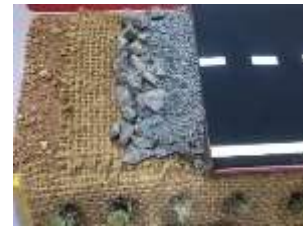
Gambar 2. Contoh Geotekstil Sabut Kelapa.

Industri Otomotif: Sabut kelapa telah dianggap sebagai bahan potensial untuk interior mobil, termasuk bantal kursi dan jok. Sifat sabut kelapa yang ringan dan tahan lama menjadikannya pilihan yang menarik. Mebel dan Desain Interior: Sabut dapat dimasukkan ke dalam furnitur dan elemen desain interior. Sabut ini digunakan untuk membuat permadani, karpet, dan barang-barang dekoratif karena tekstur dan daya tarik estetikanya. Geotekstil dan Teknik Sipil: Geotekstil sabut kelapa digunakan untuk stabilisasi tanah dan pengendalian erosi dalam proyek-proyek teknik sipil (Cherian, 2023). Serat memberikan kekuatan dan stabilitas pada tanah.