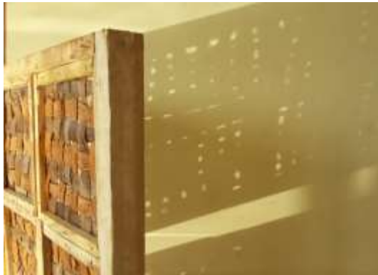
Gambar 12. Hasil Pencahayaan dari Anyaman Kulit Kelapa

Kesimpulan dari eksperimen ini mengindikasikan bahwa penggunaan kulit luar buah kelapa yang dianyam sebagai partisi ruangan multifungsi menunjukkan potensi besar dalam memberikan nilai tambah estetika, fungsionalitas, dan keberlanjutan dalam desain interior. Partisi ruangan dari kulit luar buah kelapa yang dianyam memberikan sentuhan estetika alami dan menarik. Pola anyaman dan tekstur alami kulit kelapa menciptakan atmosfer ruangan yang hangat dan eksklusif.