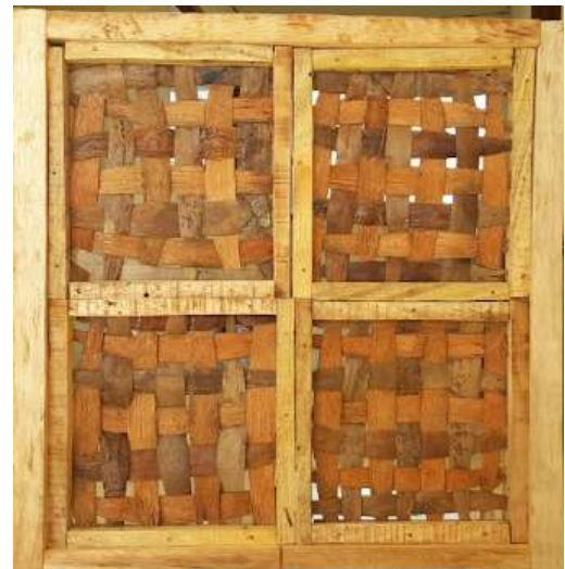
Gambar 11. Hasil Penggunaan 4 Modul ukuran 20cm x 20cm menjadi 40cmx40cm

Dalam percobaan penelitian ini, 1 modul bingkai anyaman kulit luar kelapa diatur dalam modul 40cm x 40cm dengan penggunaan 4 modul bingkai yang dibingkai kembali dengan 1 bingkai besar. Pengaturan modul ini dapat bervariasi sesuai kebutuhan dan sesuai keinginan pengguna.