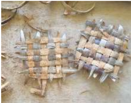
Gambar 8. Kulit Luar setelah dianyam

Panjang kulit luar kelapa (sabut kelapa) setelah dikupas dan diluruskan dapat bervariasi, tergantung pada beberapa faktor seperti ukuran kelapa dan tingkat proses pelurusan. Biasanya, panjang sabut kelapa dapat berkisar antara 16 hingga 20 sentimeter setelah diluruskan. Jika dianyam akan ada ujung-ujung yang tidak sama panjang (dapat dilihat pada gambar 8), hal itu tidak perlu diratakan karena akan dimanfaatkan sebagai bagian yang akan dijepit oleh bingkai kayu.