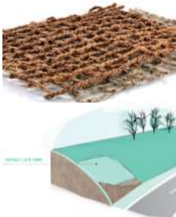
Gambar 1. Matras Pengendali Erosi.

Pengendalian Erosi dan Lansekap: Sabut biasanya digunakan untuk alas dan selimut pengendali erosi. Sabut membantu menstabilkan tanah, mencegah erosi, dan mendorong pertumbuhan vegetasi. Dalam lansekap, sabut dapat digunakan untuk berbagai aplikasi, termasuk mulsa.