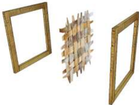
Gambar 9. Pembingkaiian Hasil Anyaman

Bingkai penjepit dapat menggunakan kayu berukuran 5 cm. Bingkai penjepit ini diperlukan agar hasil anyaman kulit kelapa tidak bergoyang dan kokoh. Teknik ini dapat dikembangkan dengan cara lainnya.